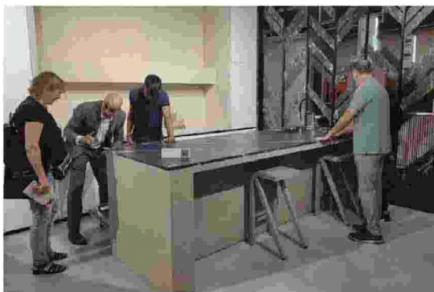
Stand de Sapienstone.

Sapienstone mostrò assieme la sua ultima novità, la evoluzione de la tecnologia Full-body de Iris Ceramica Group, al que pertenece la firma, hacia el 4D a la que define como la cerámica más sostenible del mundo. Como en la naturaleza, la superficie cerámica 4D nace por estratificación y se vuelve granítica. Sólida como una roca, compuesta por minerales naturales, contiene en 12 y 20mm de espesor toda su historia y los elementos que dan origen a la vida: el agua, el fuego y la tierra.